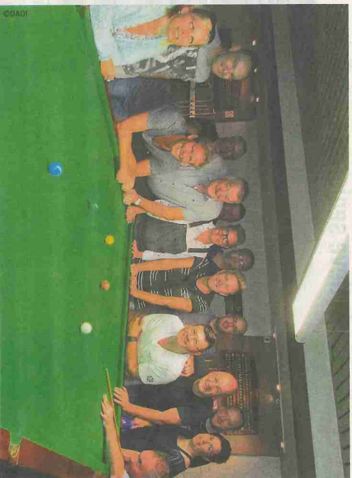
Het nieuwe snookerseizoen wordt al druk voorbereid.

"We zijn wel erkend maar krijgen geen subsidies van Sport Vlaanderen (ex-Bloso, red) zodat onze provinciale werking vooral via lidgeld betaald wordt. Dit was eerst problematisch want de toen-